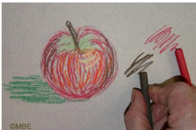
Рисунок кончиком пастели.

Самый простой способ использовать пастель состоит в том, чтобы рисовать концом, держа мелок как карандаш.