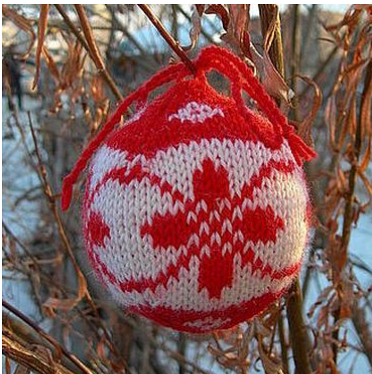
Фото работ отправляем в ЛС ВКонтакте https://vk.com/maria_lihacheva