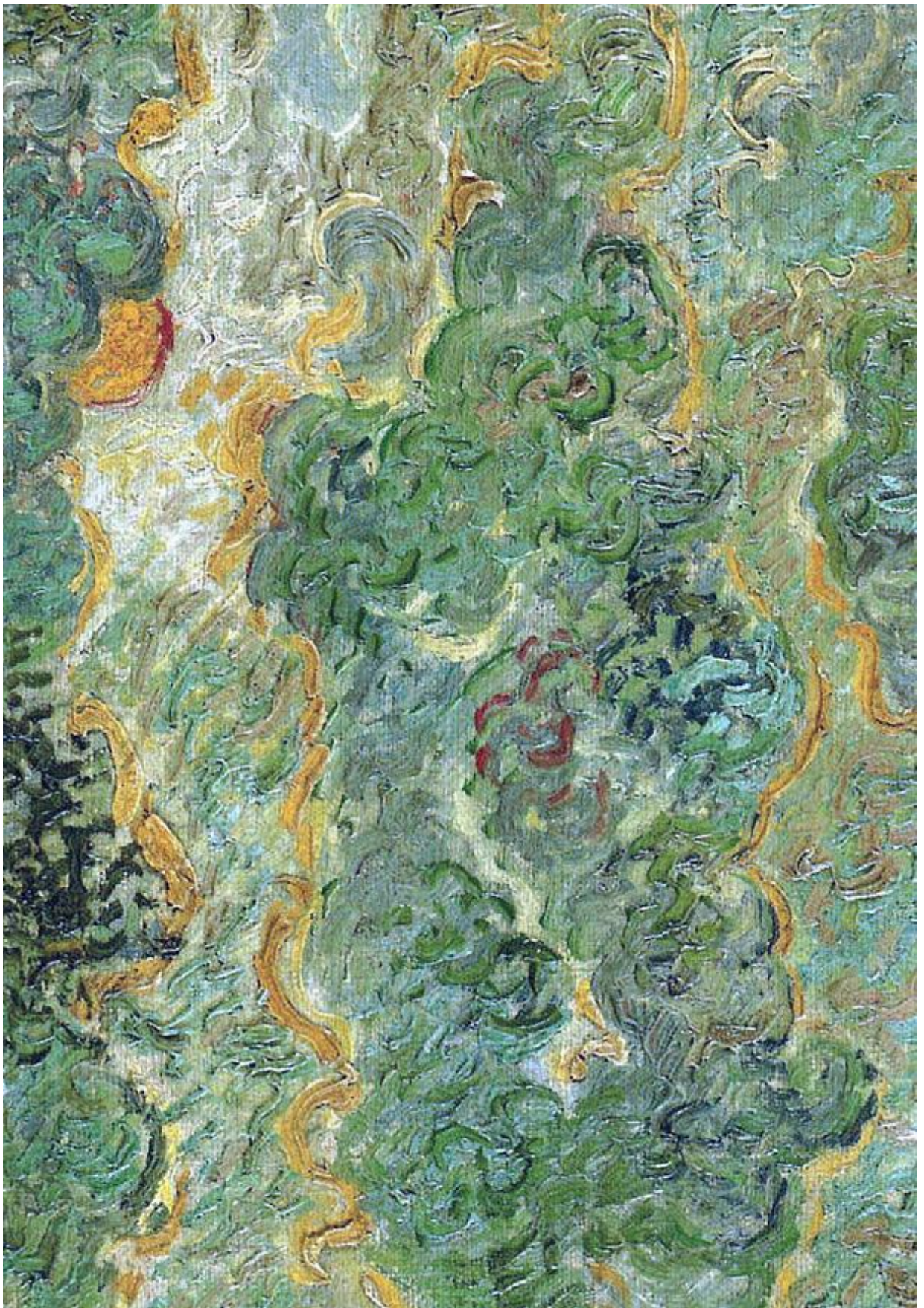
Ван Гог «Дома и кипарисы: воспоминание о Севере».