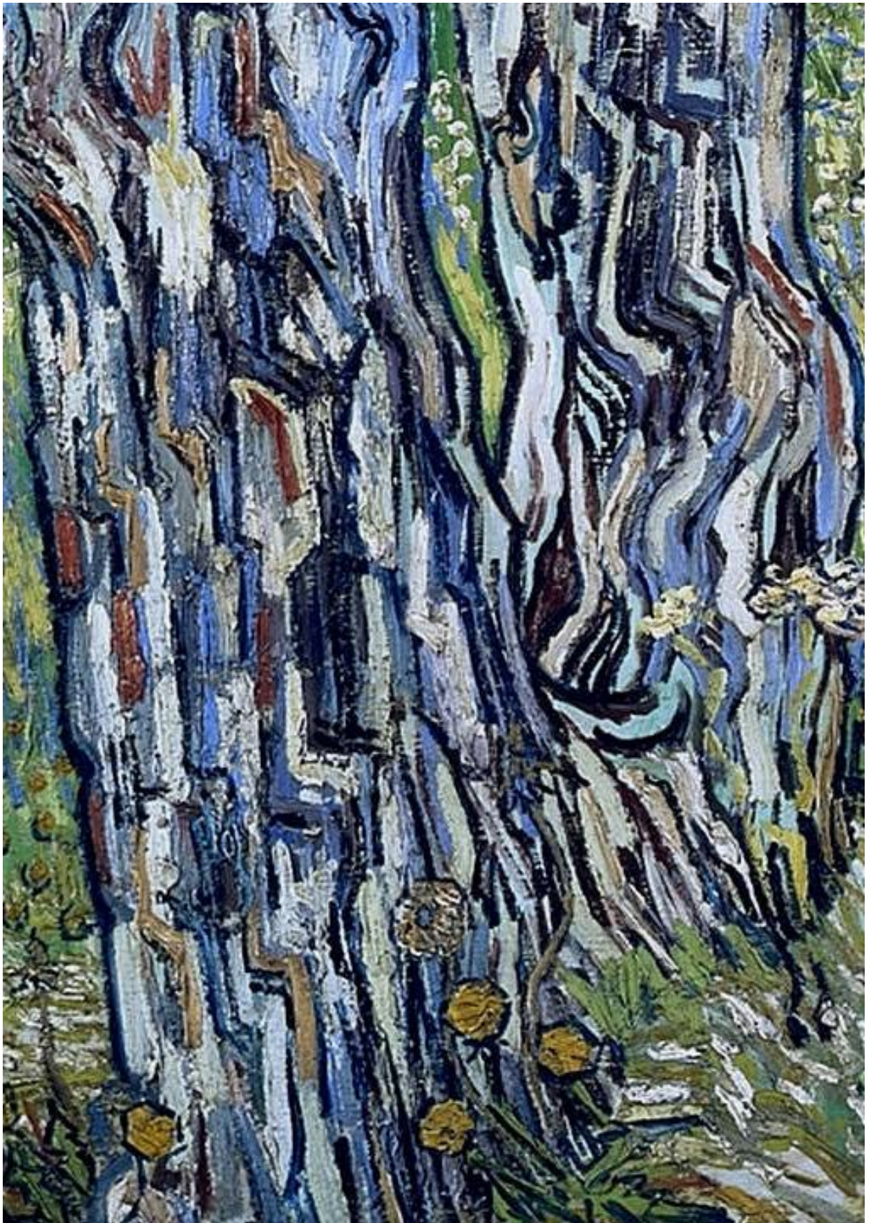
Ван Гог «Сосны и одуванчики в саду больницы Сен-Поль».